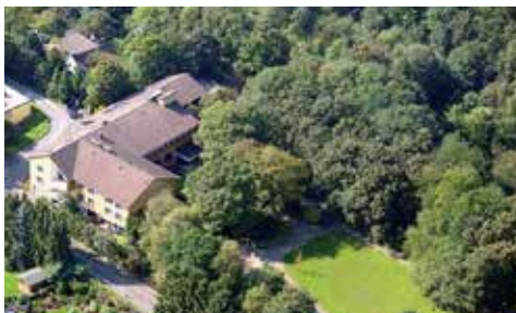
Haus am Turm

EZ Etagen D+WC: 280 € / DZ Etagen D+WC: 240 €