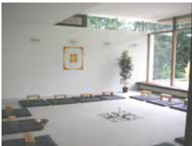
Haus der Stille Rengsdorf